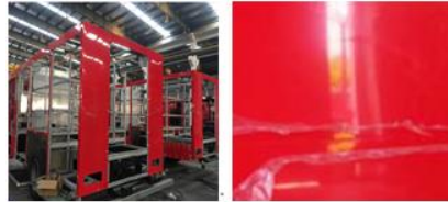
电泳预喷烤漆附膜铝板